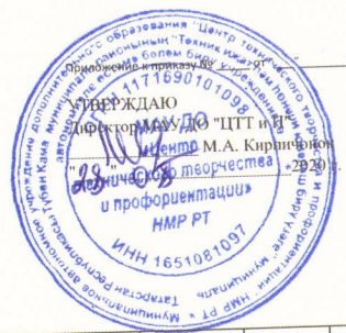
График учебного процесса для обучающихся МАУ ДО "Центр технического творчества и профориентации" по дополнительным общеобразовательным программам технического и социально-педагогического направления на 2020 - 2021 учебный год